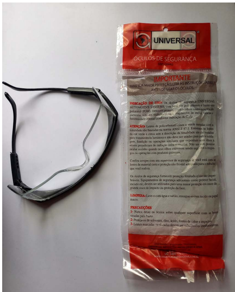
Figura 1 - Imagem das amostras recebidas

Em cumprimento ao item 4.2 (Da amostra do objeto), do Apêndice do Anexo I – Estudo Técnico Preliminar do Pregão Eletrônico nº 90015/2025, a empresa TORRÃO EQUIPAMENTOS E ACESSÓRIOS LTDA encaminhou amostra para avaliação, dentro do prazo.